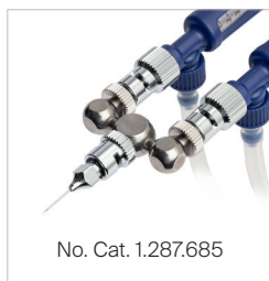
No. Cat. 1.287,685